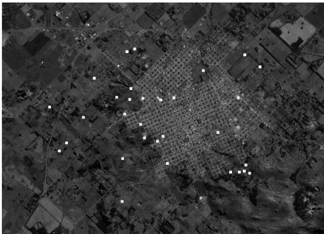
Figura 2. Sitios de disposición final de RAF, extraído de E. Miguel (2009) [24].

En este contexto, resulta complejo elaborar un indicador que monitoree dicha situación por la falta de disponibilidad de instrumental específico capaz de aportar la información sobre el funcionamiento de este sistema, que contiene múltiples y complejas variables. Si bien este trabajo se limita a construir indicadores aplicables al área de estudio, se considera que de poder contar con estos datos, el indicador debería construirse a partir del concepto de peligro de contaminación del acuífero propuesto por Foster e Hirata (2002) [31] - el uso de la expresión “peligro de contaminación del agua subterránea” tiene exactamente el mismo significado que “riesgo (medido en términos pro-